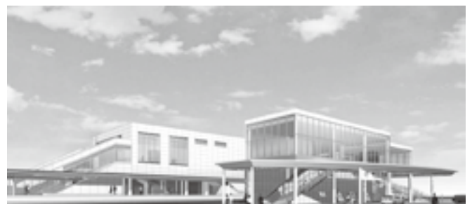
J R 春日井駅南口完成予想図