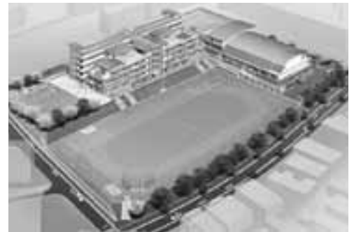
新藤山台小学校完成予想図

高蔵寺ニュータウンの藤山台中学校区内に位置する3つの小学校を統合し新藤山台小学校が今年4月に開校しました。残る2つの小学校跡地と建物を有効に活用するために旧藤山台東小学校は図書室や児童館、地域包括支援センター等の機能を有する地域の拠点施設として整備する計画です。旧西藤山台小学校については民間活力の導入を含め施設の活用方法を検討していく予定です。