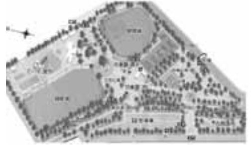
現在の県営朝宮公園

市民の競技力向上や健康増進、屋外スポーツ活動の場を広げるためにも、早期実現に向けての期待が高まりつつある多目的総合運動広場の整備については県営朝宮公園の移管を含め、整備構想を検討していく計画です。