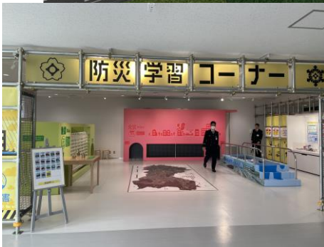
【防災学習コーナー】