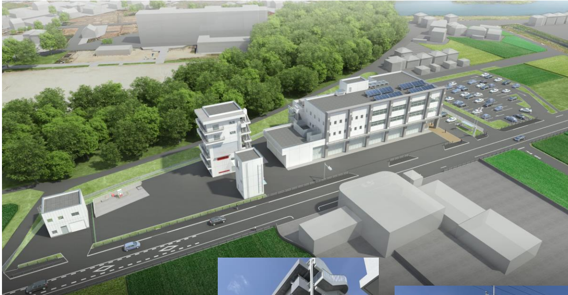
【新消防署完成パース図】

あわせて、篠木小学校南側に隣接する消防団第3分団詰所も北城町の消防署敷地内に移転することになり、お互いの連携強化が期待できます。旧消防署跡地(梅ヶ坪町)は移転に伴い今年度、建物解体工事が行われる計画です。